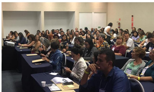
Capacitação In Company | Guarapari - ES Escuta Especializada