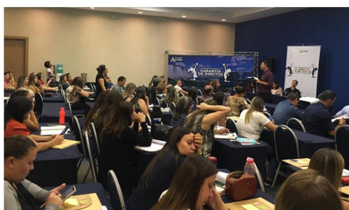
Seminário SGD Curitiba/PR