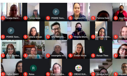
Capacitação In Company | Nova Lima - MG Trabalho Infantil

Além de nossa Agenda de Eventos mensais, o Cairo Instituto também oferece os Serviços de Capacitações, Cursos, Conferências, Seminários e Congressos In loco, nos formatos presencial e on-line.